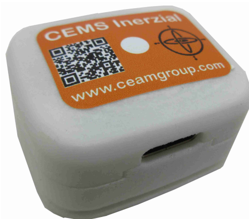
Vers. Housing Compatto

Segnaliamo anche che, per le applicazioni più strutturali, è stata sviluppata la versione 02, adatta al montaggio fisso anche outdoor.